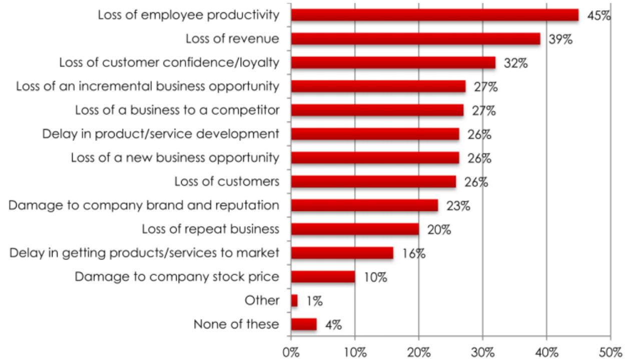
Figure 6: Sources of Economic Loss From Security Breaches